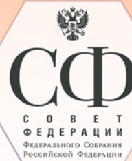
С О В Е Т ФЕДЕРАЦИИ ФЕДЕРАЛЬНОГО СОБРАНИЯ РОССИЙСКОЙ ФЕДЕРАЦИИ