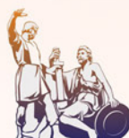
Общественная палата Российской Федерации ОБЩЕСТВЕННАЯ ПАЛАТА РОССИЙСКОЙ ФЕДЕРАЦИИ